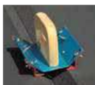
Нож K-FLEX для резки угла 90°