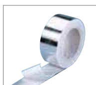
Лента алюминиевая самоклеящаяся AA 130