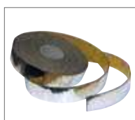
Лента самоклеящаяся AIR METAL RUBBER