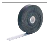
Лента самоклеящаяся AIR RUBBER