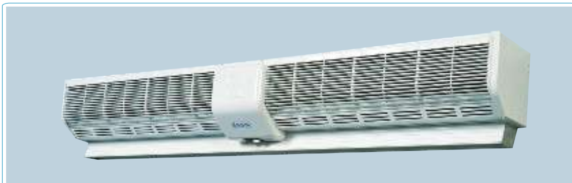
Модель К-28 (с клавишными переключателями)