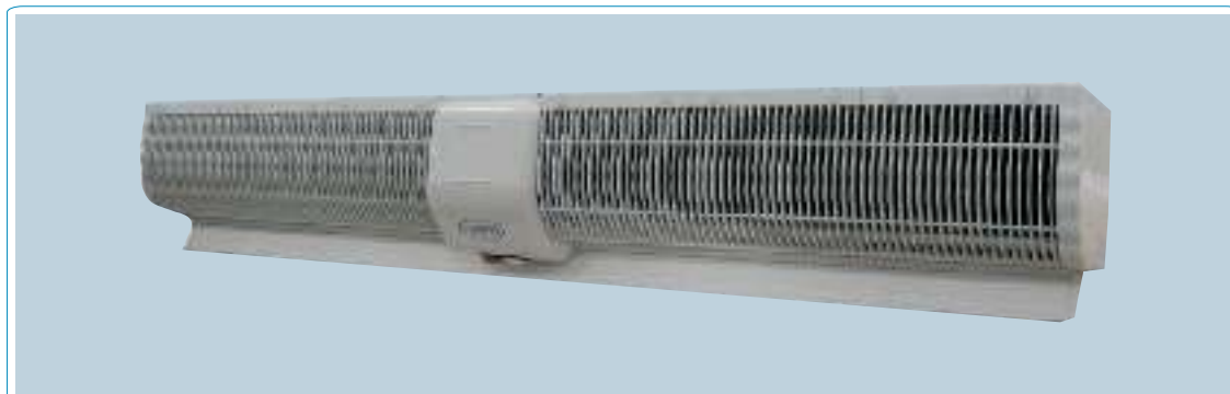
Модель K-14W (с клавишными переключателями)