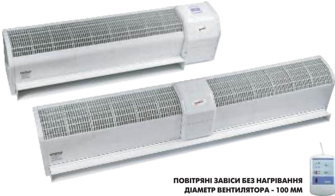
ПОВІТРЯНІ ЗАВІСИ БЕЗ НАГРІВАННЯ ДІАМЕТР ВЕНТИЛЯТОРА - 100 ММ